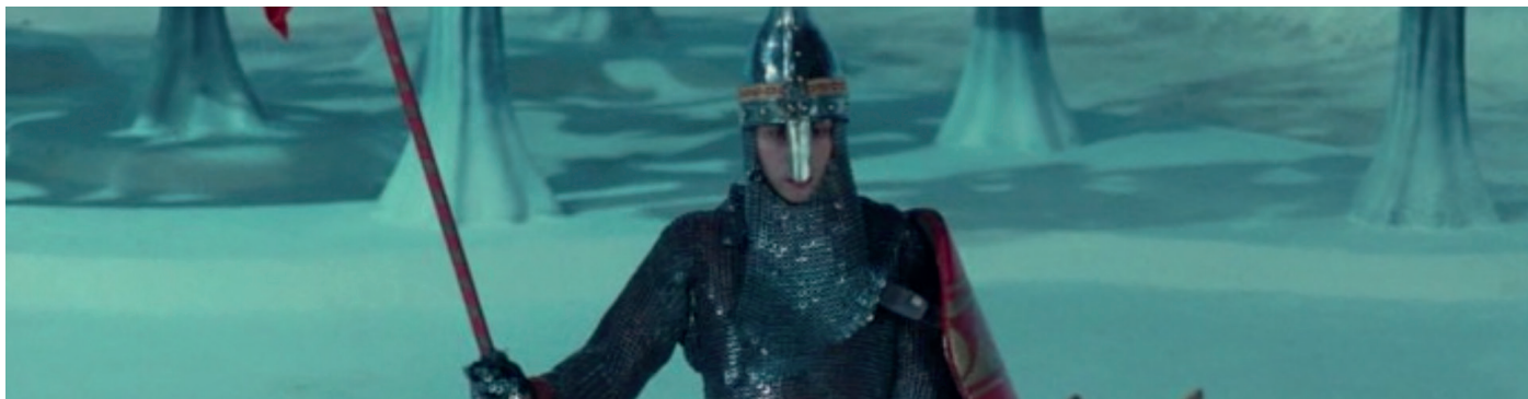
Fotograma de la pel·lícula Lancelot du Lac de Robert Bresson

Los Detectives ens conviden a pensar el present més immediat, un temps definit per una cerca incessant de la imatge, pròpia i aliena.